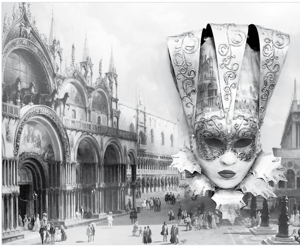
«Джюли» – женский вариант маски Джокера