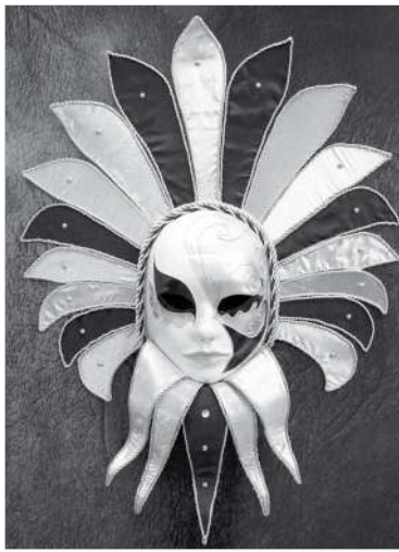
Маска «Венецианская дама»