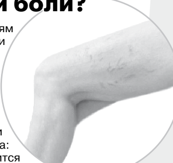
Лич. ЛО-26-01-005600 от 15.12.2020.