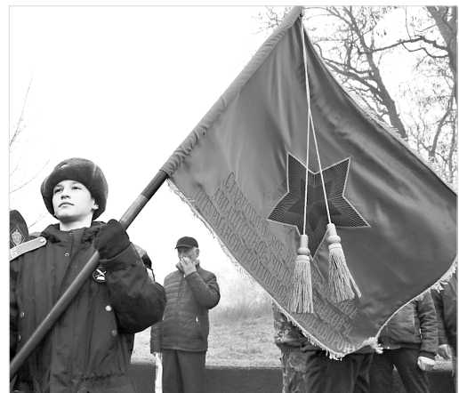
В руках кадета СПКУ – Знамя Ставропольского высшего военного авиационного училища