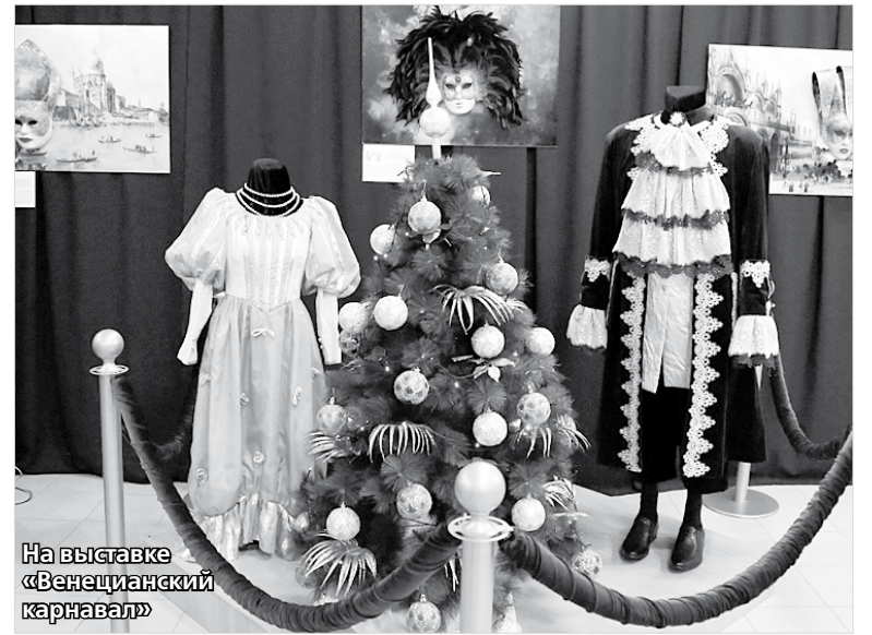
На выставке «Венецианский карнавал»